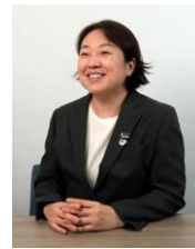
市川氏画像使用許可取得済